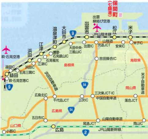
■お車 広島より：約3時間40分 松江より：45分 ※共に有料道路使用