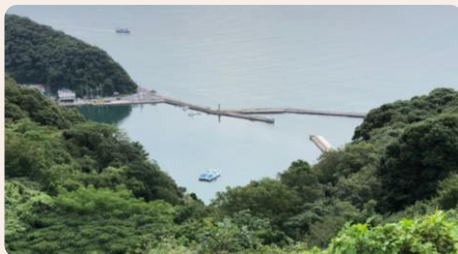
お題写真② 美保湾のハート