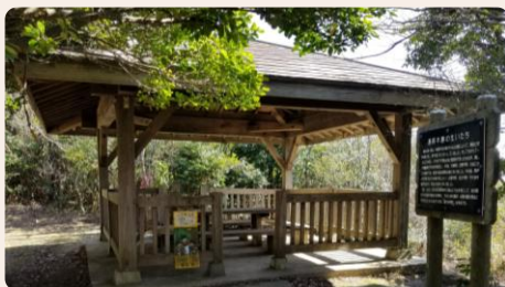
スタンプ② 遊歩道中の東屋