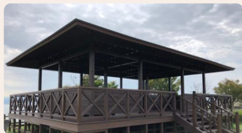
スタンプ① 五本松公園の東屋 (スタンプ用紙設置個所)