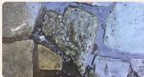
お題写真① 青石畳のハート