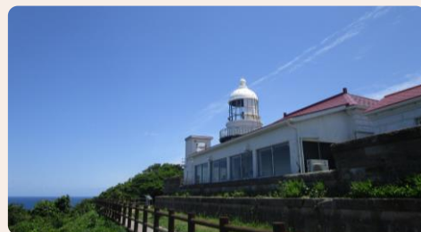
スタンプ③ 灯台ビュッフェ (休館の際は「なかうら美保関売店」)