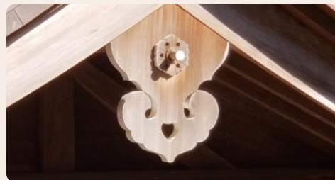
お題写真③ 美保神社のハート